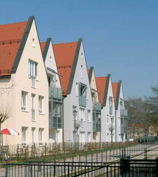
In Memmingen steht das ehemalige AWO-Seniorenheim für Geflüchtete aus der Ukraine bereit.

erstandenen Lebensmittel und Hygieneartikel von zirka 30 Ehrenamtlichen, darunter auch ehemals aus Ländern wie Syrien und Afghanistan geflüchtete Menschen. Damals wurden diese in den ersten Tagen nach Ankunft in Deutschland von Sikorsky und ihren Kolleg*innen beraten, mittlerweile setzen sie sich ehrenamtlich bei der AWO ein.